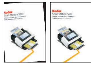
▲一般的なスキャニング: 傾いたままスキャンされてしまう ▲パーフェクトページによるスキャニング: 自動でイメージの傾きや余計なバックグラウンドの除去を実行