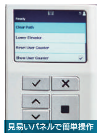
見やすいパネルで簡単操作