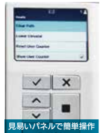
見やすいパネルで簡単操作