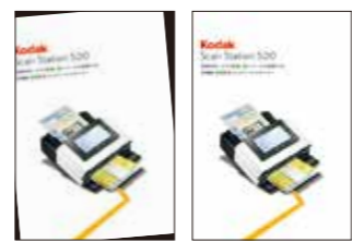
▲一般的なスキャン：傾いたままスキャンされてしまう ▲パーフェクトページによるスキャン：自動でイメージの傾きや余計なバックグラウンドの除去を実行