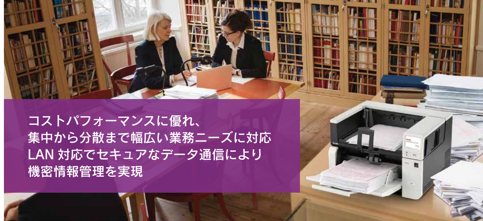
S3000 シリーズ フィーダー容量最大 300 枚

コストパフォーマンスに優れ、 集中から分散まで幅広い業務ニーズに対応 LAN 対応でセキュアなデータ通信により 機密情報管理を実現