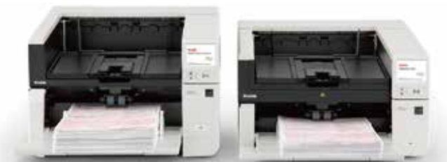
S3000Max シリーズ フィーダー容量最大 500 枚

S3000Max シリーズでは最大 500 枚、S3000 シリーズでは最大 300 枚対応のドキュメントフィーダーにより大量のスキャン作業を一度に行えます。また本体背面を開いてストレートパスとすれば、通常では難しい厚紙の原稿、長尺原稿もスキャンできます。